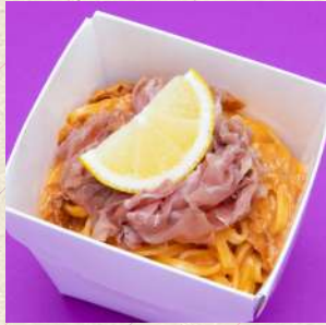
生ハムとレモンの トマトクリームソース

TOMATO CREAM SAUCE WITH PROSCIUTTO AND LEMON