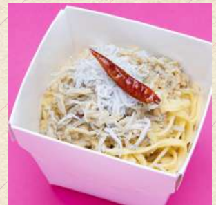
釜揚げシラスの ペペロンチーノ