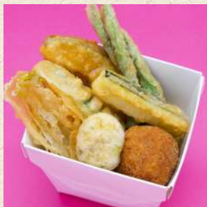
野菜のフリット盛り合わせ