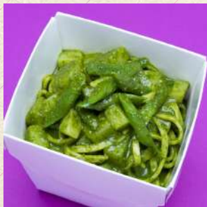
ジェノヴェーゼ (バジル、チーズ、アーモンドソース)