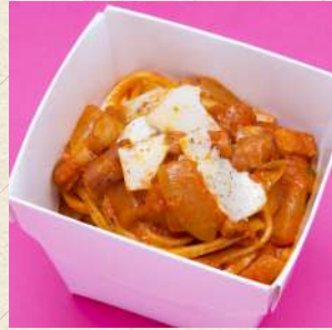
アマトリチャーナ 厚切りベーコンと玉ねぎの トマトソース

TOMATO CREAM SAUCE WITH PROSCIUTTO AND LEMON