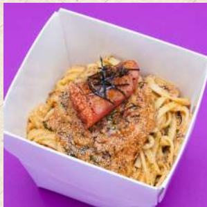
たらこと大葉の ペペロンチーノ