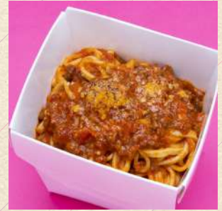
牛タンのボロネーゼ (ミートソース)

SPICY TOMATO SAUCE WITH HOMEMADE SAUSAGE