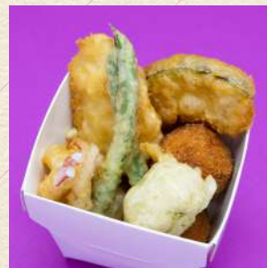
ミックスフリット盛り合わせ