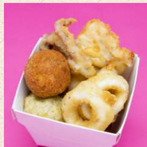
魚介のフリット盛り合わせ