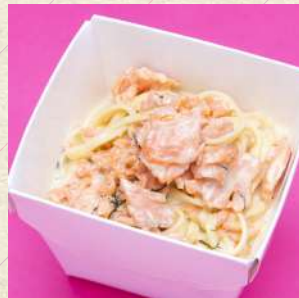
スモークサーモンの クリームソース