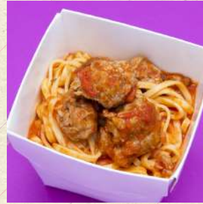
自家製ソーセージの ピリ辛トマトソース

AMATRICIANA TOMATO SAUCE WITH SAUTEED THICK BACON AND ONION