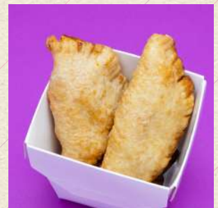
パンツェロッティ